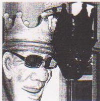
Gekrönte Häupter mit coolen Durchblick