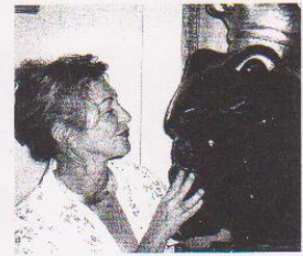
Kuss für den »Prinzen im Froge«!